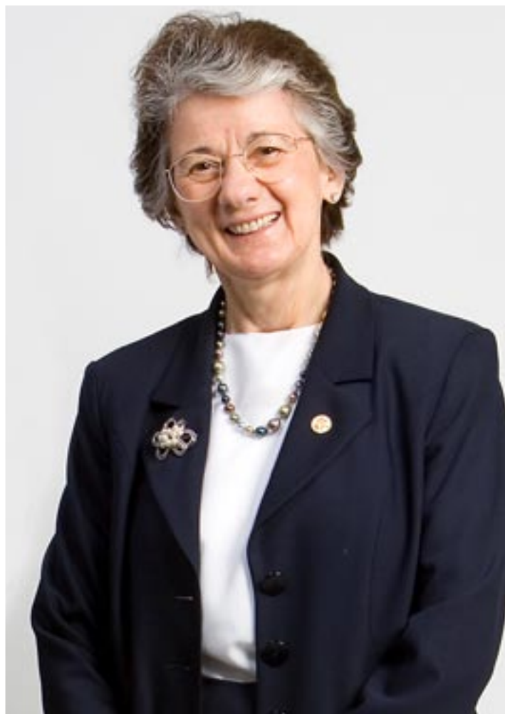
Rita Colwell, årets pristagare.

Hon har hjälpt till att leda utvecklandet av bioinformatik, ett forskningsområde där biologi, datavetenskap och informationsteknik kombineras,