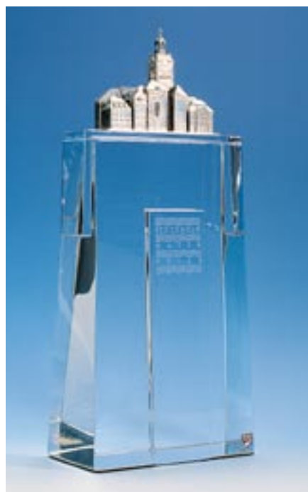
Pristagaren belönas med 150 000 USD och en specialdesignad glasskulptur från Orrefors.

Dr Colwell, 76 år, är vida erkänd som en av århundradets mest inflytelserika röster inom vetenskap, teknik och politik relaterad till vatten och hälsa. Hon har på ett enastående sätt bidragit till att förhindra spridningen av kolera, en vattenburna sjukdom som smittar mellan 3 och 5 miljoner människor och leder till uppskattningsvis 120 000 dödsfall varje år. Genom banbrytande och innovativ forskning och årtionden