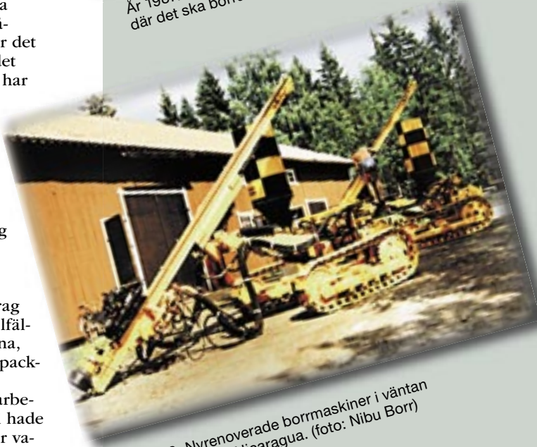
År 1989: Nyrenoverade bormaskiner i väntan på transport till Nicaragua.